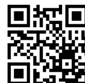
4県を繋いだ閉会の様子は こちらから (YouTube に飛びます)