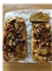
バナナケーキは 高知事務所長の手作り！