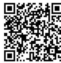
メールマガジン登録