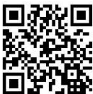
四国支部ホームページ